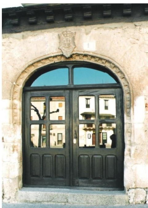
Fig.: Portada principal de la casa-palacio de Fernán González, coronada por el escudo abacial de Sn. Pedro de Arlanza.

Que la casa que se alzó en este solar perteneció al Conde castellano parece fuera de toda duda, aunque el origen de este edificio, tal y como hoy la conservamos o concebimos, y su asignación al Conde castellano del que toma nombre no es tan claro como algunos pretenden -siglo X-, habida cuenta de que su puerta principal, la que queda presidida por el escudo abacial de Arlanza, nada tiene que ver con la pretendida casa del s. X. Cabe la posibilidad de que la puerta que bajo arco románico da a la calle de Fernán González, hoy entrada lateral y secundaria, fuera en sus principios la puerta principal, claramente orientada al sur. En época tardomedieval, hacia finales del s. XV o primeros años del s. XVI debieron acometerse importantes reformas en la casa, entre otras la construcción de la puerta que mira